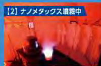
【2】ナノメタックス噴霧中