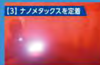
【3】ナノメタックスを定着

ご利用にあたっての 注意事項 ●一般的な素材(綿・麻・ポリエステル等)はご利用いただけますが、シルク・リアルファー・カシミア・ウール素材等高級素材に関しては、お客様判断にてご利用ください。 ●お預かりの際は、商品の状態をスタッフと確認のうえお渡しくください。 ●一部コーティングができない商品がございます。詳しくはスタッフまでおたずねください。